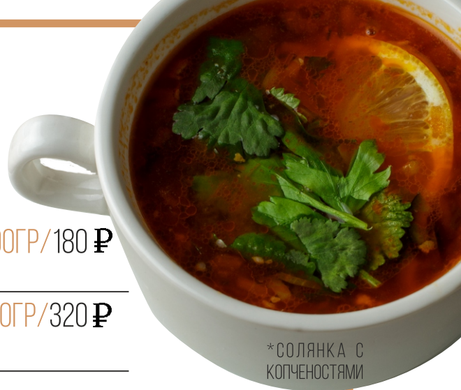
*СОЛЯНКА С КОПЧЕНОСТЯМИ